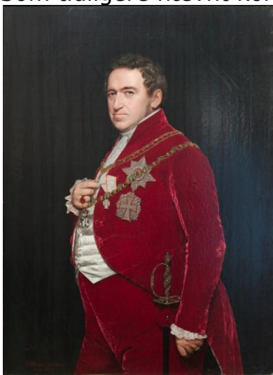
Christian d. 8.

Som tidligere nævnt kom Chr. d. 8.'s død i januar til at spille en rolle i forfatningsspørgsmålet.