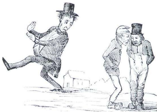
Holbæks amtmand, der ser to husmænd hviske sammen