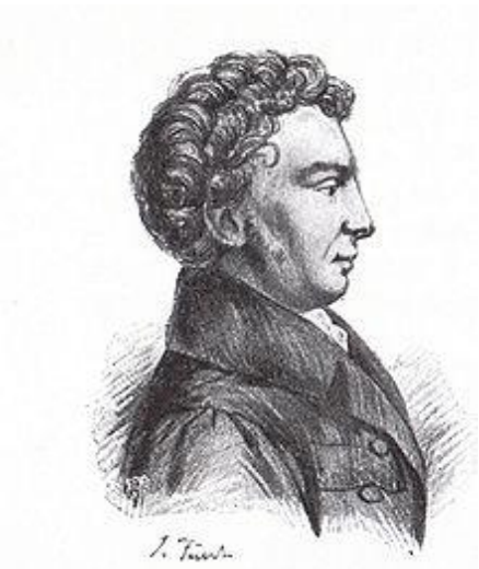
Uwe Jens Lornsen

Jeg tænker på to forhold: Udviklingen i hertugdømmerne, og kongeskiftet efter Christian d. 8's død.