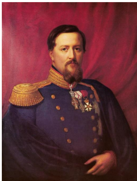
Frederik d. 7.

havde bedt om, allerede var sket. Kongen havde samme formiddag afskediget ministrene og en ny regering kunne dannes. Folkemængden råbte: Leve kongen. Enevældens tid var forbi, og ligesom ved dens indførelse i 1660 var det sket uden at løsne et skud. Nu gjaldt det om at få dannet et ministerium, der var handlekraftigt. Det blev en konservativ-liberal regering med vægt til de