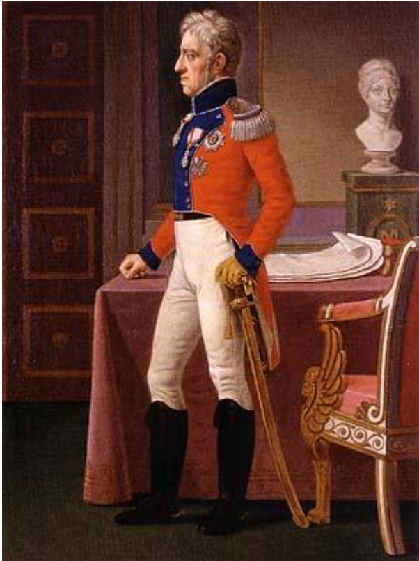
Frederik d. 6.

Ved Wienerkongressen efter Napoleonskrigene havde Frederik d. 6. i 1814 fået lov at beholde Holsten, som den del af det danske monarki på betingelse af, at der oprettedes rådgivende stænderforsamlinger. Nu blev han udefra mindet om dette, og selv om Frederik d. 6. gennem årene var blevet mere og mere centralistisk præget af en "Vi alene vide - politik", så fandt han det klogest at komme en voksende standsbevidsthed i sit folk i møde ved at indføre rådgivende stænderforsamlinger i hele sit rige. Det blev i alt til fire, nemlig i Holsten, Slesvig, Roskilde for øerne og Viborg for Jylland. Hverken fra