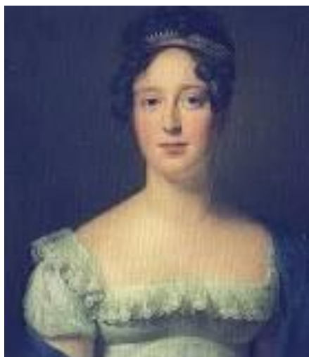
Dronning Caroline Amalie