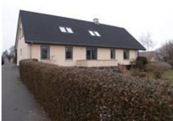
Sæby gamle skole fra 1874

Der kom lægprædikanter fra Skælskør - egnen, som f.eks.