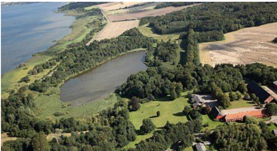
Tissø med Sæbygård

Men nu er emnet for mit foredrag: De religiøse vækkelsesbevægelser i Holbæk amt, og her må vi tage ned til egnen omkring Tissø.